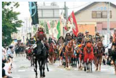
国指定重要無形民俗文化財 相馬野馬追（南相馬市）