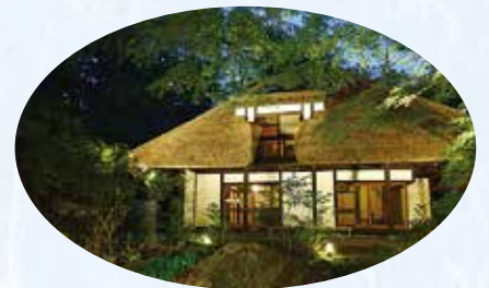
草野心平記念図書館 天山文庫（川内村）