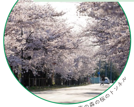
夜の森の桜のトンネル