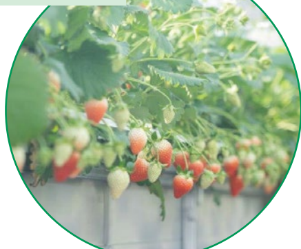
町の特産品「いちご」

大熊町では、移住者の「やってみたいことに思い切って挑戦してみる」を応援する「大熊チャレンジ応援プログラム」があります。企画実施の費用負担やイベント進行のアドバイスなど幅広いサポートを行います。また、大熊町移住定住支援センターで「無料職業紹介所」を併設し、町内にある事業所の求人をご紹介します。新たに求人サイト「くまジョブ」を開設しました。住宅支援や子育て環境も充実！大熊町で新しい生活を始めてみませんか？