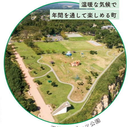
天神岬スポーツ公園