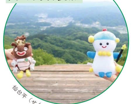
仙台平 (せんだいひら)